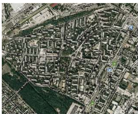
József Attila-lakótelep szerkezete, a házak között sok zöldfelülettel

Ezen a lakótelepen, talán éppen az emberléptékű kialakításából is következően, az emberek nem zárkóznak el egymástól, a házakban, az utcán szóba állnak egymással, érdeklődnek egymás iránt. A közösségi tereken sakkoznak, kártyáznak, a kisgyerekes családok a játszótéren beszélgetnek. A közösségi házban sportolási lehetőség, kártyaklub működik rendszeresen. Nyugdíjas szervezetek, csoportok közös programokat szerveznek tagjaiknak. A helyben alakult egyesületeknek befogadó teret biztosítottak a helyi politikai szervezetek és az önkormányzat, segítették a helyi kezdeményezések megvalósulását.