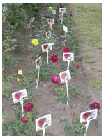
2008-as rózsatövek a névtáblácskákkal

Eljutottunk ahhoz az ismerethez, hogy a Pöttyös utcai bölcsőde előtt fővárosi pályázati támogatással pihenőparkot alakítanak ki, amiben az önkormányzat részére nem jelentene jelentős plusz költséget a családok által igényelhető rózsatövek ültetése.