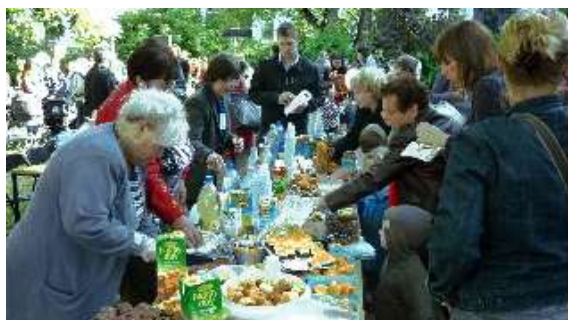
a 2011-es rózsaparki ünnepségen a Vagány Nők kínálnak a piknikasztalnál

Nagyobb rendezvényeink után igyekszünk „köszönő-rendezvényt” szervezni: saját magunknak és a nekünk segítő külsősöknek is megköszönjük az elvégzett munkát, felidézük a sikereket és az esetleges gondokat. Kisebb rendezvények után a közös e-mail használatával igyekszünk legalább írásban megköszönni egymásnak az elvégzett