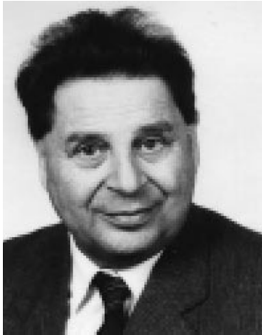
Vámos Tibor a kuratórium elnöke, akadémikus, az MTA rendes tagja