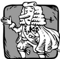
AZ ÁLLAM ÉN VAGYOK.

Budapest egyik lakótelepén rendre vasárnap délután trillázott körbe a Family Frost fagyaltos kocsjá. Amikor az egyik anyukát és családját sokadszorra verte föl vasárnap délutáni álmából, lement, és elkérte a sofőrtől a főnökének a mobilszámát. Ezt követően az anyuka kiplakátozta a környéken: „Ha Önt is zavarja délutáni pihenésében a Family Frost, ezt a számot hívja: 06 xx xxx-xxxx” Attól kezdve nem délután jött a fagyaltos kocsi.