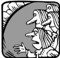
MEGBOCSÁSSON FELSÉG, DE EGYEDÜL NEM SOKRA MEGY...