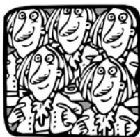
AZ ÁLLAM MI VAGYUNK.